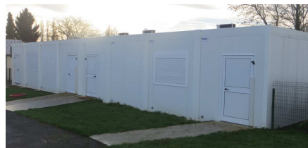
Modulaires pour ouverture de classes